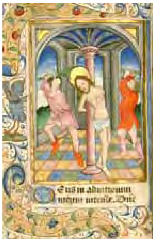
Châlons, BM, ms 1716 f. 30v

Six films de grande qualité proposent la découverte de pages non exposées, donnant à voir les détails dont regorgent les enluminures.