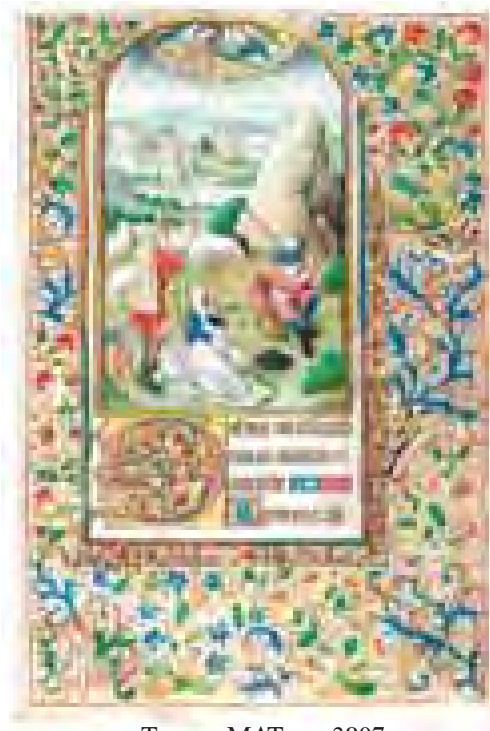
Troyes, MAT, ms 3897