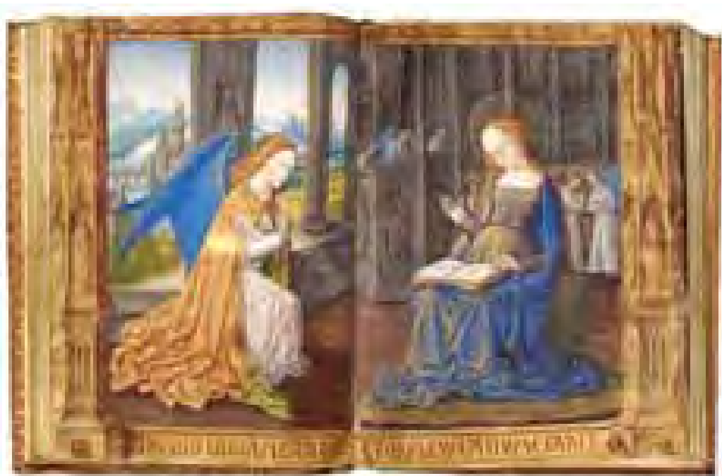
Troyes, MAT, ms 3901, Annonciation

à partir du 1 er juillet 2007 à la Médiathèque de l'Agglomération Troyenne