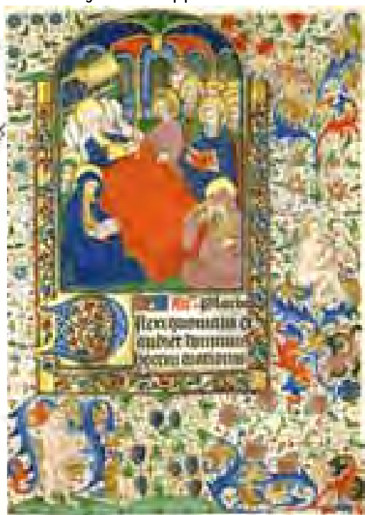
Reims, BM, ms 2852 f. 89