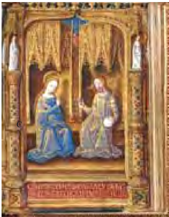
Troyes, MAT, ms 3901

L'exposition virtuelle souhaitée pour inciter les visiteurs à venir voir l'exposition, sera dotée d'une interface attrayante et conforme à la charte graphique élaborée pour l'exposition. Elle sera accessible en ligne sur le site d'Interbibly : www.interbibly.fr .